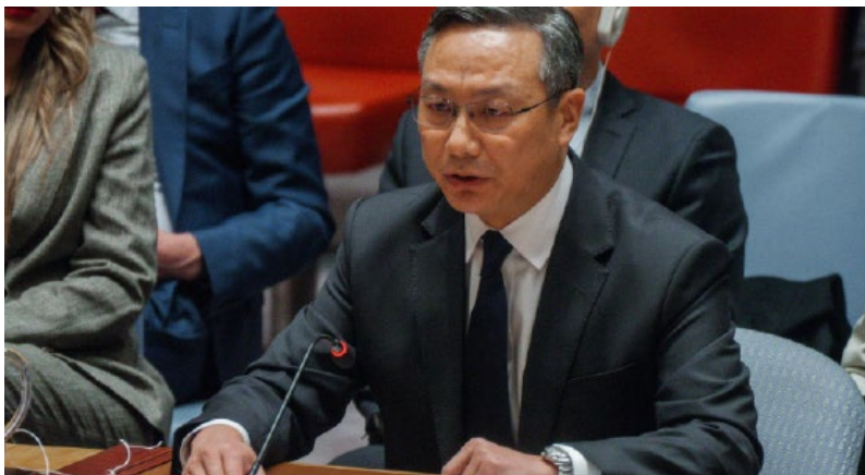
China's Deputy Permanent Representative to the United Nations, Sun Lei, speaks during a UN Security Council briefing at the UN headquarters in New York, on December 23, 2025.

Poco antes de la captura de Nicolás Maduro, el representante adjunto de China ante Naciones Unidas, Sun Lei, instó a Washington a cesar acciones que afectaran la seguridad de la navegación y a levantar “sanciones unilaterales ilegales” 17 . Tras la captura de Maduro el 3 de enero, el Ministerio de Comercio chino afirmó que mantendría la cooperación económica con Venezuela pese a lo que calificó como una “flagrante violación del derecho internacional” 18 .