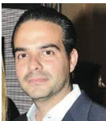
Francisco Convit Gurrucaga