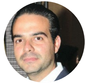
Francisco Convit Guruceaga