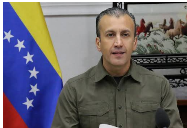
Tareck El Aissami