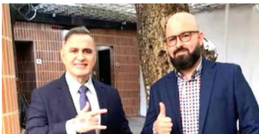
Tareck El Aissami

La misma suerte habría corrido también el fiscal 67 Nacional, Farik Karin Mora Salcedo , uno de los dos encargados de investigar el llamado caso Pdvsa-Cripto, la trama de corrupción presuntamente liderada por Tareck El Aissami, exministro del Petróleo, que desfalcó al menos 16.960 millones de dólares 2 , según estimaciones de nuestra organización, a la empresa estatal petrolera y que tuvo ramificaciones en la Superintendencia de Criptoactivos, la Corporación Venezolana de Guayana (CVG) y otras empresas públicas.