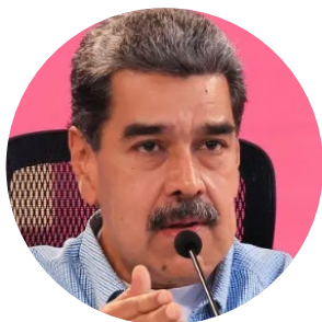
Nicolás Maduro Moros

Expresidente del Tribunal Supremo de Justicia. Entre 2017 y 2018 fue sancionado por Canadá, Estados Unidos, Reino Unido, Siza, la Unión Europea y otros países. Luego, en 2023, la Justicia estadounidense lo acusó de lavado de dinero producto de corrupción en Venezuela.