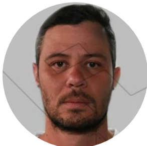
Walter Jacob Gavidia Flores

Fiscal general de la República designado por la extinta Asamblea Constituyente de 2017, exdefensor del pueblo y exgobernador del estado Anzoátegui por el Partido Socialista Unido de Venezuela (PSUV). Entre 2017 y 2018 fue sancionado por Estados Unidos, Canadá, Reino Unido, Suiza, la Unión Europea y otros países.