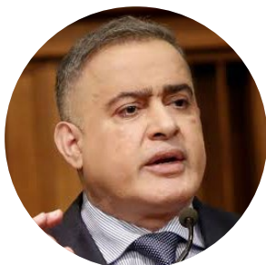
Tarek William Saab

Exvicepresidente de Venezuela y exministro de Petróleo. Entre 2017 y 2019 fue sancionado por Estados Unidos, Canadá, Reino Unido, Suiza, la Unión Europea y otros países. Fue detenido en abril de 2024 por su presunta vinculación con la trama de corrupción llamada PDVSA-Cripto.