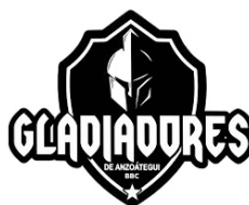
Gladiadores de Anzoátegui (baloncesto)