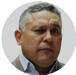
Pedro Miguel Carreño Escobar

Presidente de Venezuela desde 2013. En 2017 y 2018 fue sancionado por Estados Unidos y Canadá.