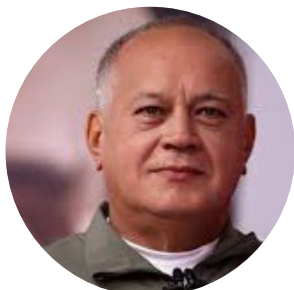
Diosdado Cabello Rondón

Vicepresidenta de Venezuela, vicepresidenta del Área Económica y ministra de Petróleo. Entre 2017 y 2018 fue sancionada por Canadá, Estados Unidos, Reino Unido, Suiza, la Unión Europea y otros países.