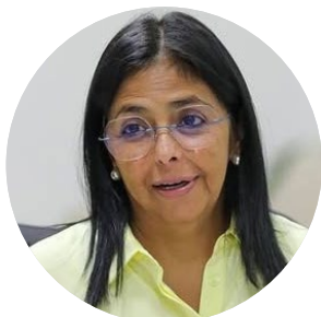
Delcy Eloína Rodríguez Gómez

Coronel de la Guardia Nacional Bolivariana y jefe de la Dirección de Asuntos Especiales de la Dirección General de Contra Inteligencia Militar (Dgcim). La Misión de Determinación de Hechos de la ONU lo señaló por torturas y tratos crueles. En 2019 fue sancionado por Estados Unidos, Reino Unido, Suiza, la Unión Europea, y otros países.