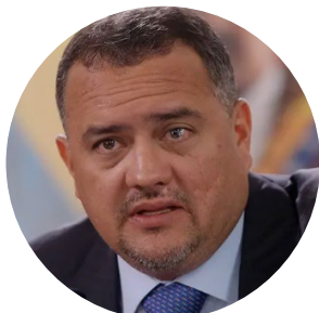
José David Cabello Rondón

Ministro de Interior, Justicia y Paz y primer vicepresidente del Partido Socialista Unido de Venezuela (PSUV). Entre 2017 y 2018 fue sancionado por Canadá, Estados Unidos, Reino Unido, Suiza, la Unión Europea y otros países.