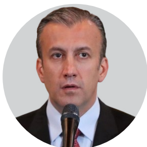
Tareck Zaidan El Aissami Maddah

Exvicepresidente de Venezuela y exministro de Petróleo. Entre 2017 y 2019 fue sancionado por Estados Unidos, Canadá, Reino Unido, Suiza, la Unión Europea y otros países. Fue detenido en abril de 2024 por su presunta vinculación con la trama de corrupción llamada PDVSA-Cripto.