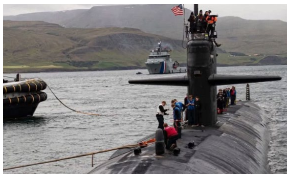
Submarino nuclear de ataque USS Newport News (SSN-750)