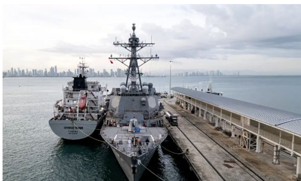
El buque de guerra USS Sampson atracó en la Terminal Internacional de Cruceros Amador, en Ciudad de Panamá.

El despliegue militar estadounidense en el mar Caribe, con 8 buques de guerra equipados con misiles, aviones de vigilancia, un submarino de ataque de propulsión nuclear, a los que sumaron el 14 de septiembre 5 aviones cazas F-35 y un Boeing C-5, ha derivado en dos semanas en un ataque a una lancha el 2 de septiembre, con 11 muertos, y otro con tres fallecidos, el 15 de septiembre.