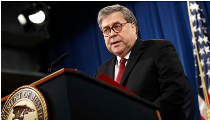
Fiscal general, William Barr

En marzo de 2020 el Departamento de Justicia acusó a Nicolás Maduro, a través del entonces fiscal general, William Barr, junto a otros funcionarios venezolanos, de narcotráfico y ofreció una recompensa que fue elevada en 2025 a 50 millones de dólares.