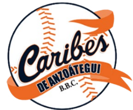
Caribes de Anzoátegui

Los clubes restantes (Leones del Caracas, Cardenales de Lara, Águilas de Zulia y Bravos de Margarita) pertenecen a consorcios privados o grupos familiares de varias generaciones de tradición, lo que no implica que dejen de transar con el oficialismo para garantizar su supervivencia, como casi toda actividad bajo un Estado de tintes totalitarios.