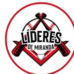
Líderes de Miranda