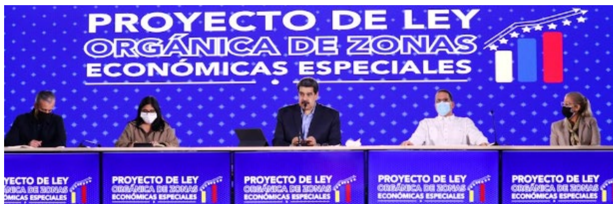
El contexto en el que China impulsó sus ZEE era muy distinto al venezolano

Expertos en las relaciones sino-venezolanas expresan que, a pesar de los anuncios y eventos, desde China hay escepticismo respecto a los potenciales beneficios de participar en las ZEE en Venezuela. Un grupo de autoridades venezolanas insisten en seguir el modelo de desarrollo aplicado por China a través de sus ZEE y constantemente hacen declaraciones sobre sus logros. Sin embargo, el contexto en el que China impulsó sus ZEE era muy distinto: “estaba abierta al mundo, contaba con el beneplácito de países occidentales, tenía un buen ambiente para la realización de inversiones y negocios, organizó las ZEE por sectores geográficos y sectores económicos y se apoyó en centros de investigación de universidades durante el proceso”, afirma uno de los expertos. En cambio, Venezuela está aislada internacionalmente, con débiles instituciones, sin seguridad jurídica ni seguridad personal, insuficiente infraestructura de comunicaciones y servicios, insuficiente capital humano, confrontación entre el gobierno y las universidades e inestabilidad política. Los representantes de China han advertido a sus contrapartes en Venezuela que se requiere estabilidad política, jurídica y física para el desarrollo. La fuente consultada también mencionó que es preciso estar atentos a lo que hará la nueva burguesía venezolana en