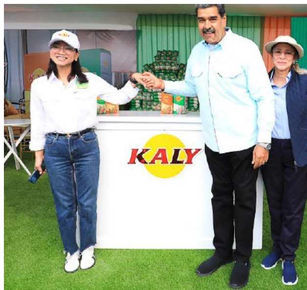
37% del consumo de harina de maíz es satisfecho por empresas chinas.

Finalmente, se conoció que inversionistas privados de China han entrado desde 2020 en el importante mercado interno de harina de maíz precocida (marcas Kaly y Mimasa) porque gozan de ventajas regulatorias para la importación de materia prima, además de ventajas fiscales respecto al resto de productores. Datos del sector indican que 37% del consumo interno de harina de maíz precocida es satisfecho por empresas chinas, mientras que la empresa Polar, que fue líder del sector durante décadas, se quedó con 33% del mercado 27 .