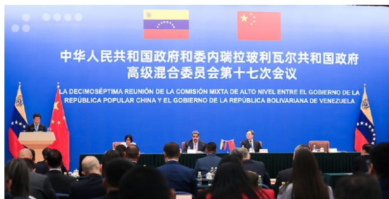
La CMAN de 2023 se firmó el Acuerdo marco de cooperación para el desarrollo minero entre el Ministerio de Desarrollo Minero Ecológico y la empresa Fullgain Industrial & Trading

& Trading para la adquisición de equipos de minería, transferencia tecnológica, exploración, explotación y construcción conjunta de una plataforma efectiva de comercio de minerales; asimismo, se firmó un Memorando de Entendimiento entre el Servicio Geológico de China y el Instituto Nacional de Geología y Minería de Venezuela, para fortalecer el Plan Nacional de Geología y una vez más apoyar la cuantificación y certificación de reservas minerales 38 .