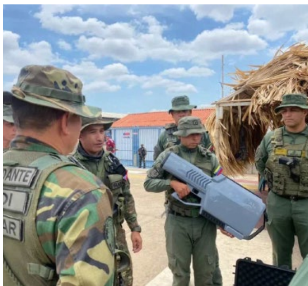
Militares venezolanos con el Hunter SHH100.

También en 2023, China entregó a Venezuela 30 misiles antitanque y antibuque negociados desde 2017, según el SIPRI 30 . En marzo de 2024, el CODAI divulgó haber recibido nuevos sistemas de interferencia de frecuencia contra vehículos no tripulados (drones) de la firma china Skyfend, tratándose particularmente del modelo Hunter SHH100 31 .