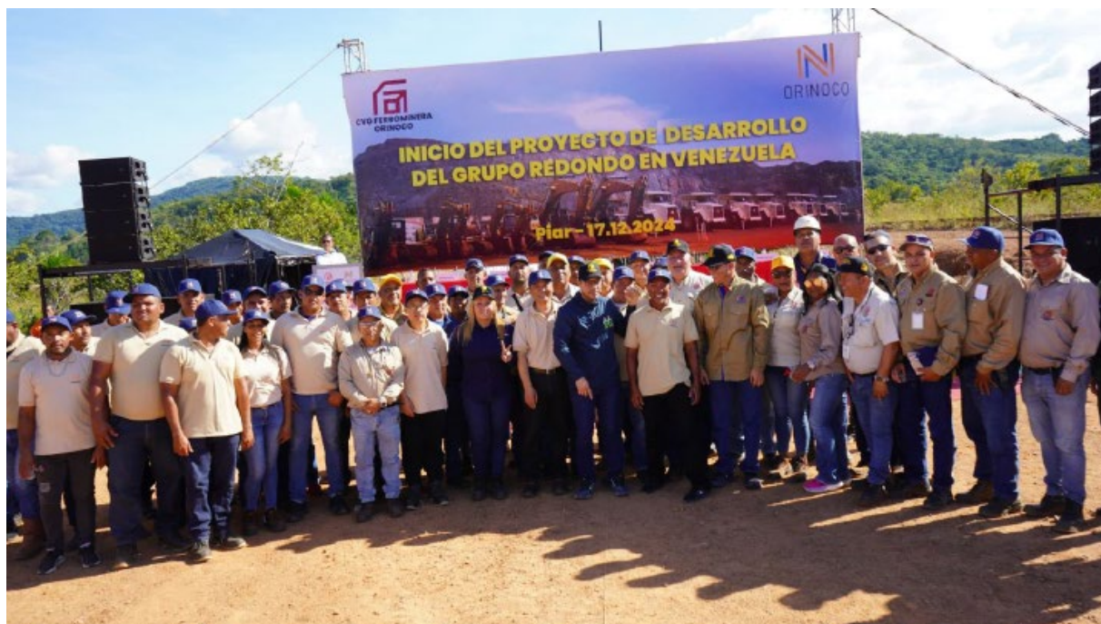
En diciembre de 2024 inició el Proyecto de Desarrollo Minero del Grupo Redondo. (Ferrominera)