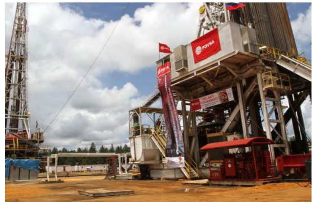
En 2024 dos empresas chinas recibieron contratos en Venezuela.

Respecto a la Industria China Venezolana de Taladros, se conoce de la importación de 15 taladros que no pudieron instalarse y no ha producido ninguno 23 , y sobre las empresas Sinovenezolana, Petrourica, Petrocaracol y Petrolera Paria no hay información. Por otro lado, fue documentado que empresas chinas operan al menos desde 2023 a través de Asociaciones de Servicios de Hidrocarburos en actividades aguas arriba, cuyos pagos los reciben en barriles de petróleo 24 .