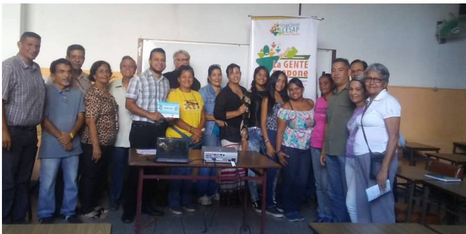
Participantes del foro sobre Gobierno Abierto en la Casa Parroquial de La Candelaria.