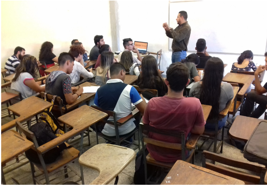
Foro "Gobierno Abierto" con estudiantes de la Universidad de Carabobo.

Los veedores municipales de distintas zonas que acompañaron la propuesta resaltaron la importancia de este órgano, por ser el articulador entre la ciudadanía y el gobierno municipal para planificar el desarrollo de la urbe. A la fecha, no ha habido respuesta satisfactoria.