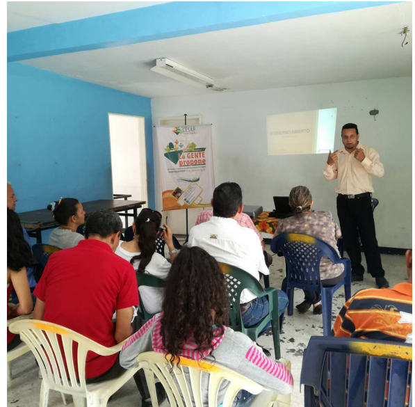
Taller sobre Gobierno Abierto en la Casa de la Cultura de la Urb. Fundación Mendoza.

El gran reto de la Alianza Gobierno Abierto Venezuela (Agav) en Carabobo era promover una forma de gobernanza completamente desconocida por las instituciones del Estado y las organizaciones de la sociedad civil, por eso, resultó estratégica la unión con la Casa del Nuevo Pueblo, una institución con penetración en sectores populares de Valencia y con importantes aliados que son referentes en la región en el área académica, defensa de derechos humanos y gerencia pública.