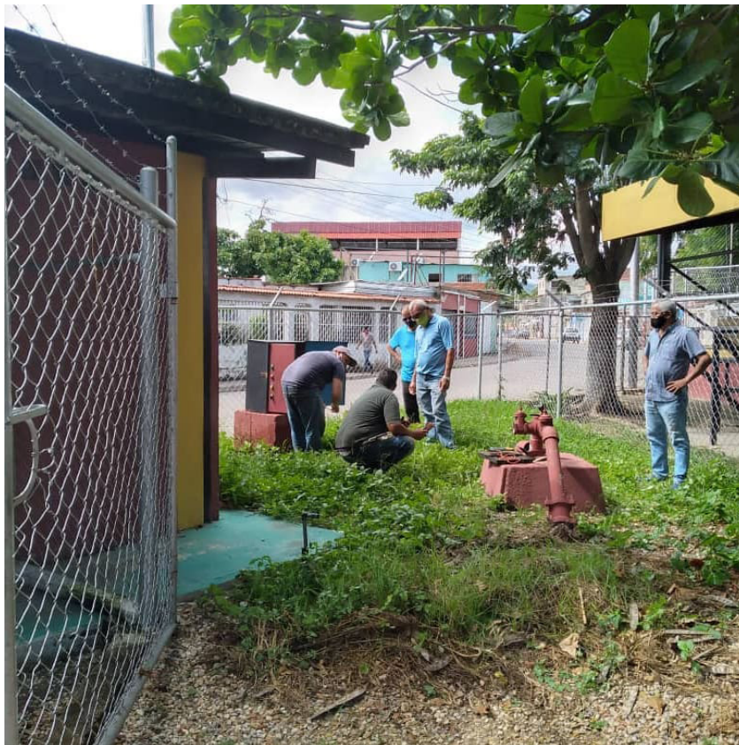
Trabajos de reactivación del pozo de agua del barrio Aquiles Nazoa.

El presidente de la Asociación Civil Casa del Nuevo Pueblo considera que todavía hay mucho por hacer para lograr un Gobierno Abierto en Valencia, entre otras cosas, falta ciudadanía. "Consideramos que debemos seguir trabajando de la mano de Transparencia Venezuela, en función de continuar realizando este tipo de labores en las comunidades. Nos falta ciudadanía, nos falta profundizar la importancia de ser ciudadanos. Debemos, además, crear una cultura de funcionarios públicos, porque un candidato a alcalde no se prepara para ello. Se prepara para ser político", sentenció.