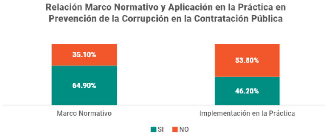
Gráfica 1. Relación Marco Normativo y Aplicación en la Práctica en Prevención de la Corrupción en la Contratación Pública