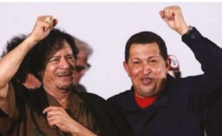
Muammar Al Gaddafi y Hugo Chávez