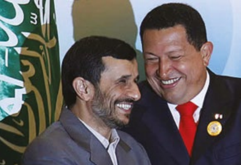
Hugo Chávez y Ahmadinejad