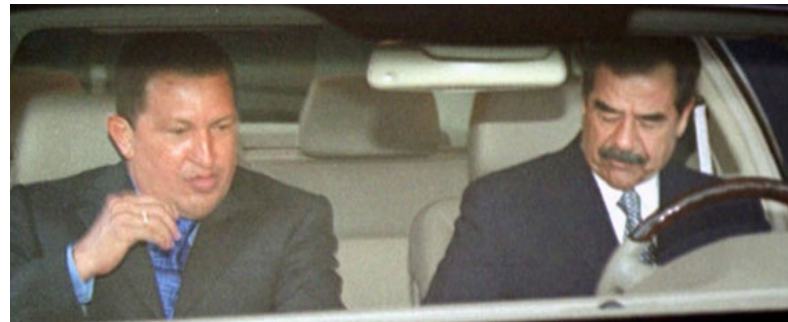
Sadam Husein y Hugo Chávez

Chávez también se alió con líderes enfrentados a EE UU como Sadam Husein (Irak) 58 , Mahmud Ahmadineyad 59 (Irán), Muamar Gadafi 60 (Libia), Bashar al-Asad 61 (Siria) y Vladimir Putin (Rusia) 62 . De estas asociaciones salieron algunos convenios bilaterales como el Fondo con Libia (2010) que contó con US$ 1.000 millones, pero se desconoce si se llegó a concretar una vez conocida la muerte de Gaddafi en 2011; el Fondo con Siria (2010) con un monto inicial de US$ 100 millones para créditos a empresarios sirios-venezolanos; además del fondo con Bielorrusia (2007) con US$ 400 millones de dólares del Fonden y el Fondo Mao Zedon, con China (2009) con US$ 20 millones 63 .