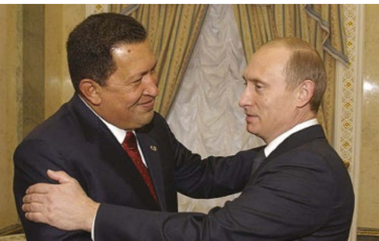
Hugo Chávez con Vladimir Putin