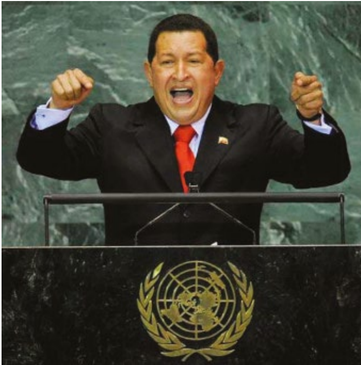
Discurso en la sexagésima primera Asamblea General de la Organización de Naciones Unidas de Hugo Chávez. 20 de septiembre de 2006

El afán de Hugo Chávez de ser el líder en América Latina fue el motor que lo impulsó a entregar dinero a manos llenas en los países del hemisferio.