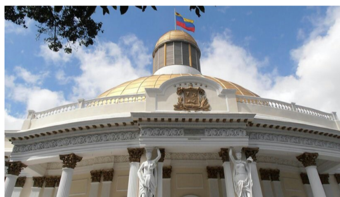
Asamblea Nacional recibió solicitud del Tribunal Supremo de Justicia en el exilio para autorizar antejuicio de Nicolás Maduro