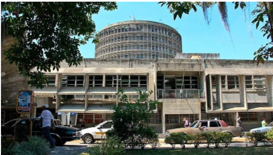
IAHULA: Instituto Autónomo Hospital Universitario de los Andes

quirúrgica se hace el reporte al Cardiológico Infantil de Caracas de los insumos usados para que éste haga el envío del dinero que permita hacer las adquisiciones en Mérida.