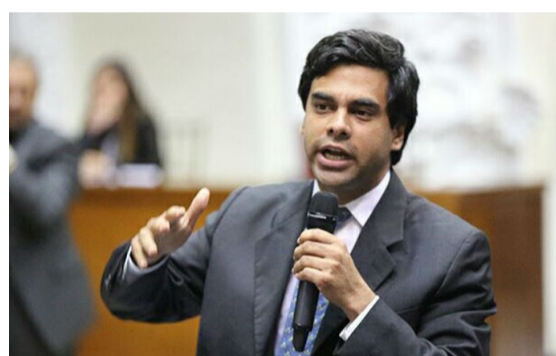
Alvarado: inflación de agosto alcanzó récord histórico en Venezuela