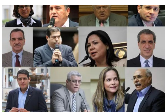
¿Cuáles son los diputados que irán por las gobernaciones?