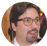
Freddy Guevara (VP-Miranda)