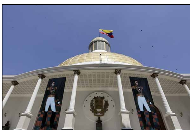
Así quedó el registro de inasistencias de la AN en 2016