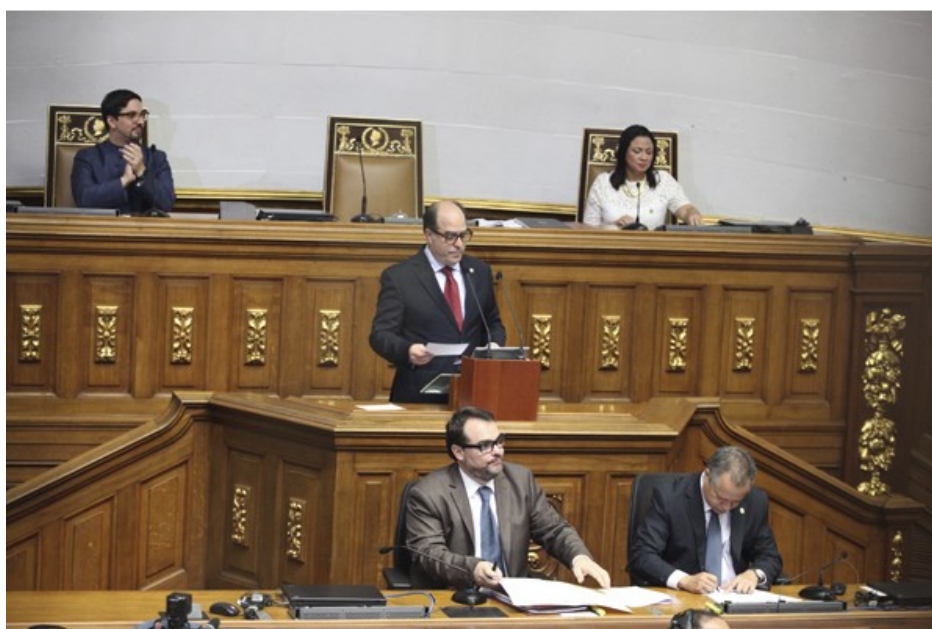
Asamblea Nacional designó su directiva para este 2017

Con el comienzo del año 2017, el Parlamento cursa su segundo año de gestión e inicia una nueva etapa del Legislativo con la escogencia de sus nuevos representantes, con quienes pretende impulsar la salida del presidente Nicolás Maduro. Para eso, el nuevo presidente de la Cámara, Julio Borges (PJ-Miranda) prometió aprobar como primer cometido el abandono del cargo del primer Mandatario.