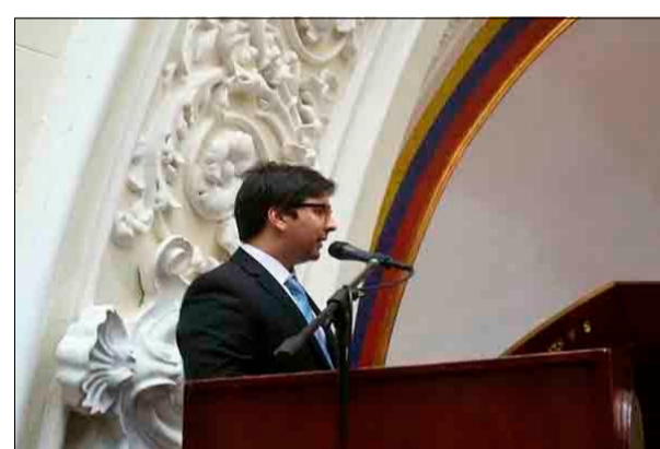
Reforma de la Ley Contra la Corrupción fue aprobada en 1era discusión