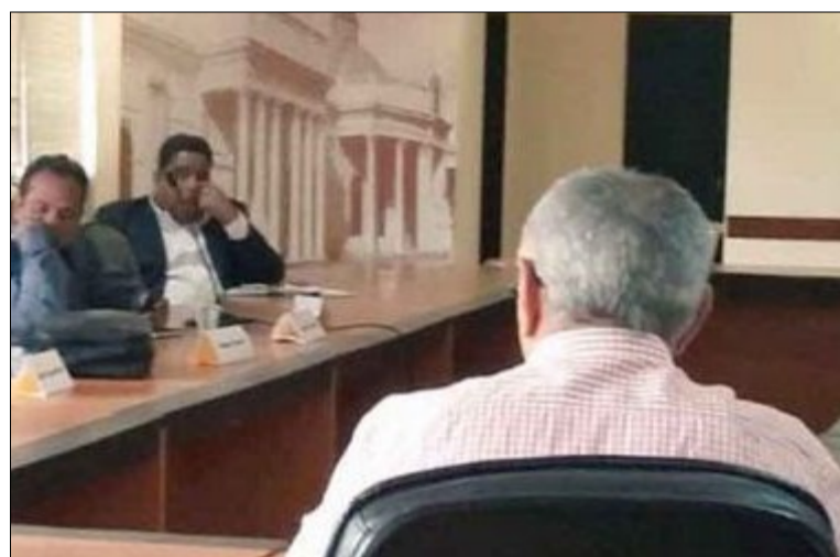
Presidente de Avelina desmiente acusaciones en su contra ante comisión de Contraloría