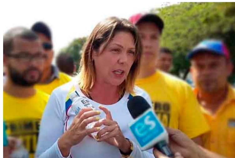
Comité de postulaciones electorales continuará reuniones durante recolección del 20%