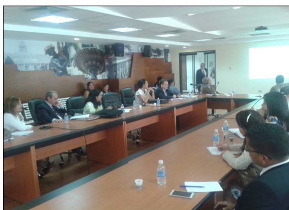
Transparencia Venezuela propone una transformación legislativa en el control fiscal