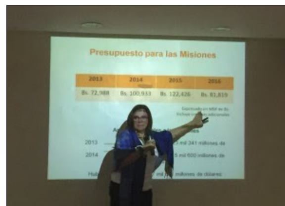
Foro "Corrupción y Hambre en Venezuela, una realidad inexcusable" abre gira nacional sobre la crisis alimentaria