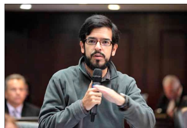
Pizarro: próxima agenda legislativa incluirá recomendaciones del EPU