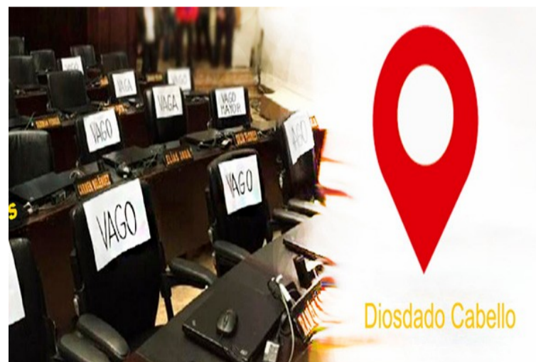
Diosdado Cabello y Cilia Flores promedian 89% de inasistencias a la AN

21-11-16 El dip. Richard Blanco (ABP- Dtto. Capital) criticó que en el documento de los acuerdos de la mesa de diálogo entre el gobierno y la oposición catalogaran a los presos políticos de "personas detenidas".