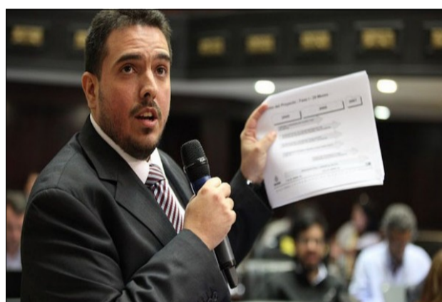
Aprobado en plenaria informe de Obras Inconclusas que han generado pérdidas millonarias