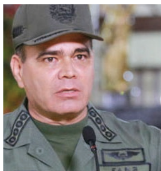
Ministro de la Defensa Vladimir Padrino López

Entre sus atribuciones se encuentra coordinar el Comando de Abastecimiento Soberano, formado por las máximas autoridades del Poder Ejecutivo y por los responsables de toda la cadena productiva del sector industrial de país. A pesar de las importantes funciones que la GMAS posee, el decreto de su conformación no especifica la personalidad jurídica ni el órgano encargado de tutelar sus actuaciones. La responsabilidad por la ejecución del proyecto queda distribuida entre los Ministerios de Defensa, Agricultura Productiva y Tierras, Agricultura Urbana, de Pesca y Acuicultura, para la Alimentación, para Industria y Comercio y para las Comunas y Movimientos Sociales.