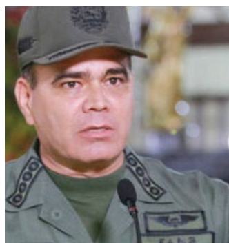
Ministro de la Defensa Vladimir Padrino López

Sobre el Comando de Abastecimiento Soberano encabezado por el Ministro de la Defensa Vladimir Padrino López se atribuye la potestad de ejercer la coordinación, planificación, y ejecución de las actividades de supervisión, seguimiento y