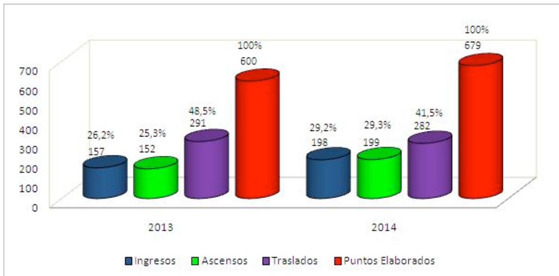
Gráfico MP - 02. Cifras comparadas de movimientos del personal fiscal. Años 2013 y 2014