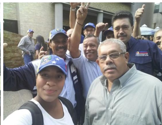
1 sept. 2016 #TomamosCaracas exigimos libertad para todos los presos políticos, @manuelrosalesg Revocatorio 2016.