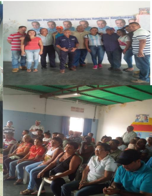
15 sept. 2016 Activando el revocatorio en Casigua. #VamosPorEl20% @PartidoUNTZulia