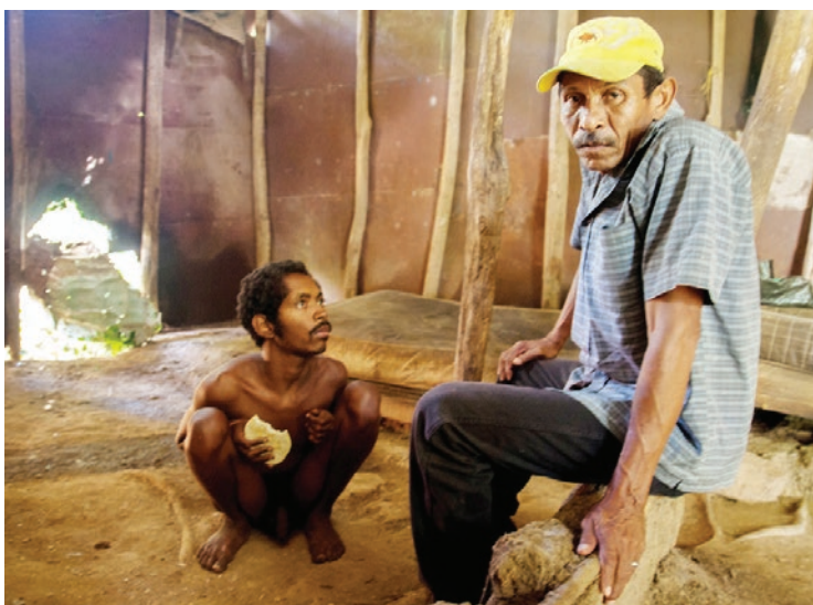
Rafael Hernández / @sincepto

La superación de la pobreza es un tema multidimensional. No es de dudarse que la implementación de estos programas sociales en las comunidades con extrema pobreza pueden coadyuvar a mejorar en cierta medida la atención a los habitantes de dichas comunidades, no obstante, no constituyen las bases de misiones una política que transversalice los derechos humanos ni mucho menos una política integral que ayude a superar la pobreza. deben ser programas