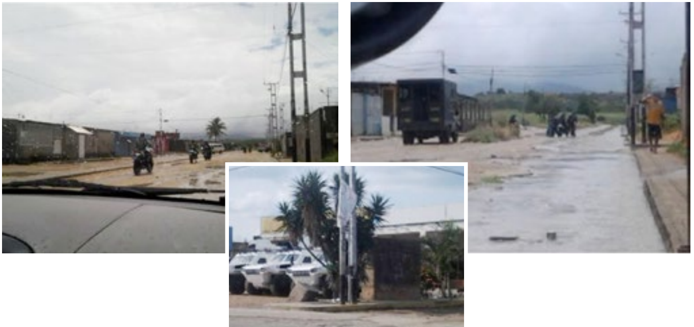
Tanquetas a la entrada de Las Sábilas

La coordinación regional de Transparencia Venezuela en Lara se dirigió al lugar. Al respecto los vecinos opinaron: "A nosotros nos parece bien que se ataque la delincuencia, pero los malandros ya no están aquí, y los que quedamos somos nosotros, quienes aquí vivimos".