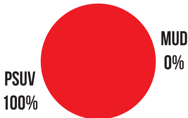
Conformación porcentual de las Presidencias y Vicepresidencias en Comisiones Permanentes

PSUV: 15 PRESIDENCIAS Y 15 VICEPRESIDENCIAS MUD: 0 PRESIDENCIAS Y 0 VICEPRESIDENCIAS