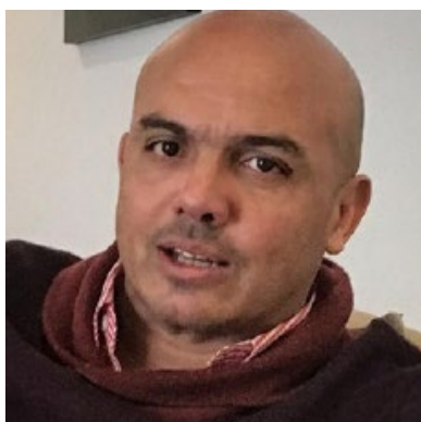
Clíver Alcalá Cordones

A pesar de los graves señalamientos en su contra, no existe en Venezuela una investigación del Ministerio Público contra el Cartel de los Soles, lo que demuestra la falta de independencia de las instituciones del sistema de Justicia.