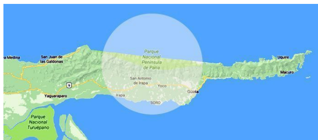
Península de Paria

Los locales aseguran que desde hace más de 15 años, organizaciones criminales tomaron el control de poblaciones enteras para dedicarse principalmente al tráfico de drogas que tienen como destino Norteamérica y países europeos. “En San Juan de Las Galdonas, Unare, Santa Isabel (todos en la Península de Paria) se mueve la droga pareja. Ahí no puede ir el que quiera, sino el que pueda. Todo, absolutamente todo, lo deciden los grupos criminales”, afirma un funcionario de un cuerpo de seguridad de Sucre que prefirió no ser identificado.