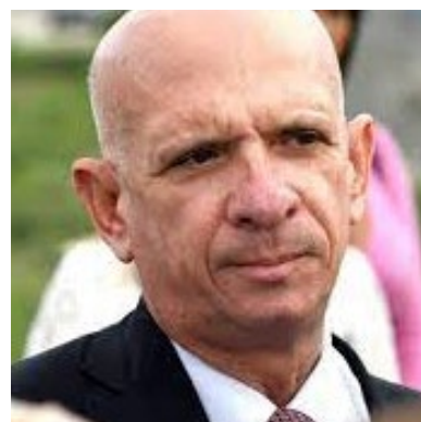
Hugo Armando Carvajal Barrios