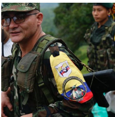
Fuerzas Armadas Revolucionarias de Colombia (FARC)