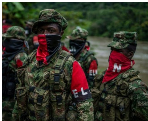
Ejército de Liberación Nacional, ELN

A inicios de 2022 se registraron fuertes enfrentamientos entre las disidencias de las